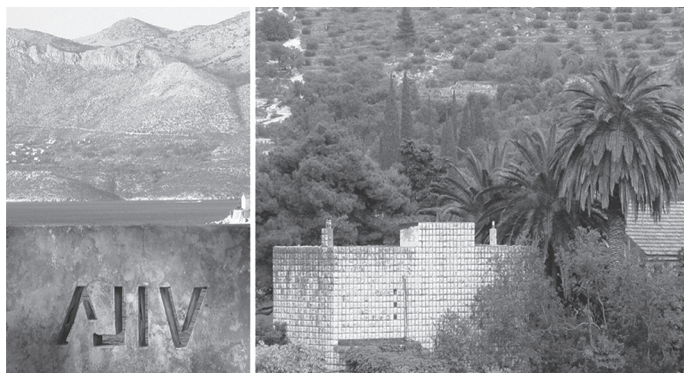
Слика 1 Никола Добровић, а) Вила Весна, Лопуд, 1939; б) Вила Свид, Затон, 1940-1941.

интуиција, постаће у времену садашњем предмет бројних истраживања и снажна фасцинација савремених архитеката. Насупрот императива објективности и рационалности који су се налазили у основи модернистичког, односно просветитељског пројекта, на почетку двадесет првог века архитекти и теоретичари архитектуре откривају нове облике уметничке и архитектонске сензитивности. 7 Добровић је у својим теоријским радовима одбацивао принципе научне естетике и модулларне координације, супротстављајући им значај сопственог, стваралачког, „духовног модула”, 8 и посебно инсистирао на улози интуиције у уметничкој продукцији и рецепцији, међутим, важно је потцртати, не без комплексног, дијалектичког односа са рационалним и интелектуалним: „Да уметност нема ничега заједничког са логиком, како то тврди Кроче, не важи за архитектуру. И најчистија интуиција архитектова мора да се храни нечим. Ни из чега и ни због чега нема интуиције.” 9