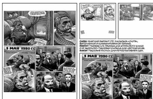
Рисунок 2. Эмуляция допечатной подготовки страниц, выполненных в комбинированной технике

на полях графических листов). Изначальный план работ предполагал чередование техник на протяжении всей книги: традиционная – для основного действия, живописная – для флэшбэков. Однако выяснилось, что в условиях тогдашней допечатной подготовки это существенно увеличило бы себестоимость печати. Каждый из двух типов рисунков предполагал разные системы цветоделения, увеличивая производственные затраты на изготовление растровых клише: для многих страниц потребовался бы удвоенный комплект (см. рисунок 2). В итоге Э. Билал столкнулся с необходимостью ограничить себя одной техникой, и выбрал живописный стиль. 11 Учитывая, что ранее он использовал его только в малостраничных рисованных рассказах, это было довольно смелое решение, но оно оказалось крайне эффективным.