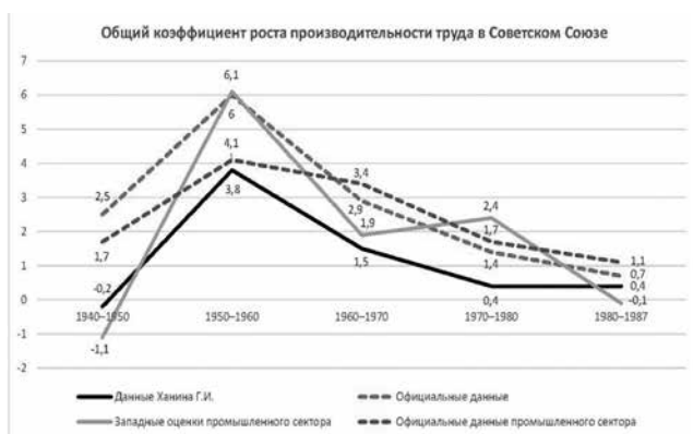
Диаграмма 1. Официальные и альтернативные оценки роста производительности труда в СССР в период 1940–1987 гг.

В цифровых значениях альтернативные данные отличались от официальных, что можно проследить, например, по сводной таблице вариантов такого существенного показателя, как рост производительности труда, приводившейся известным советским экономистом Г. И. Ханиным (Диаграмма 1) 13, 14 .