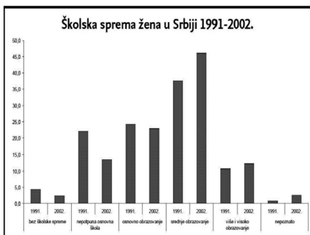
Grafikon 2: Školska sprema žena u Srbiji

nekvalifikovanih radnika: prosečna plata žena je za 20 odsto niža od plate muškaraca. Razlika u prosečnoj mesečnoj bruto-plati muškaraca i žena je sedam odsto – prema podacima iz septembra 2010. godine. Razlika u prosečnim platama je ukupno manja nego gledano po obrazovnim kategorijama zaposlenih. To može biti posledica toga što je u kategorijama zaposlenih sa visokom, višom i srednjom stručnom spremom nešto više žena nego muškaraca, dok je muškaraca više u ostalim kategorijama. Prema podacima iz Odgovora na Upitnik, stopa zaposlenosti žena i muškaraca u Srbiji razlikuje se za oko 14 procentnih poena: među muškarcima je u aprilu 2010. iznosila 45,5 odsto, a među ženama 31,4 odsto. Stopa nezaposlenosti žena u aprilu 2010. iznosila je 20,1 odsto, a muškaraca 18,6 odsto, pokazuju podaci Republičkog zavoda za statistiku. Preporuka Saveta Evrope je da zastupljenost žena u parlamentu bude najmanje 40 odsto. Srbija je sa oko 22 odsto ispod tog cilja, dok je prosek zemalja-članica Saveta Evrope 2008. godine bio 21,7 odsto”.