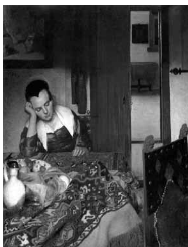
Johannes Vermeer, Žena koja spava , 1656-7, ulje na platnu, Metropolitan Museum of Art, New York

Key words: females, the socio-cultural construct, media literacy, gender roles, socialization, value system