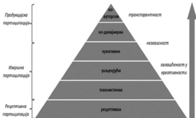
Слика 1. Пирамида партиципације: Шематски приказ нивоа партиципације у култури; Извор: Literat, I. (2012) The Work of Art in the Age of Mediated Participation: Crowdsourced Art and Collective Creativity , International Journal of Communication 6, p. 2976.

Следи извршни ниво партиципације публике, који се заснива на генерисању и уклапању парцијалних активности појединаца које су оријентисане на одређене задатке. Другим речима, корисници се укључују у унапред осмишљени пројекат, и у високо структурираном простору партиципације остварују мноштво микродоприноса. Литерат даље разлаже извршни ниво на три подтипа. 35