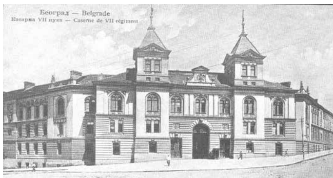
Слика 3 Касарна VII пука, Београд

оваквих законских одредаба, десило се да и пројекат једне од најлуксузнијих касарни 47 и репрезентативних јавних грађевина у престоници, Касарна VII пука у Београду (грађена крајем 19. века, саграђена 1901?), буде предмет критика са становишта санитарских карактеристика. 48 Поред тога, њена позиција у градском ткиву, није била у складу са ондашњим стручним промишљањима. Наиме, војни стручњаци су сматрали да касарну „нити је треба градити у вароши самој – из узрока лако појмљивих – нити је треба градити далеко ван вароши – те да се не отежава лак и удобан сношај и саобраћај са вароши, и обитаоцима касарне и, нарочито официрима, који имају своју службу у касарни, а у дотичној вароши станују. 2) Касарну треба градити на окрајини вароши дотичне, оној, која није на страни, у којој варош тежи, и по положају своје треба, да се развија. 3) Место за касарну треба да је узвишено над нивоом дотичне окрајине варошке, у којој се касарна гради.” 49 Позиција Касарне VII пука није одговарала ни захтеву да „пред излазом из зграде треба да има простран трем, те да не буде нагомилавања људи на самом излазу из зграде, како при уласку у њу.” 50 (слика 3)